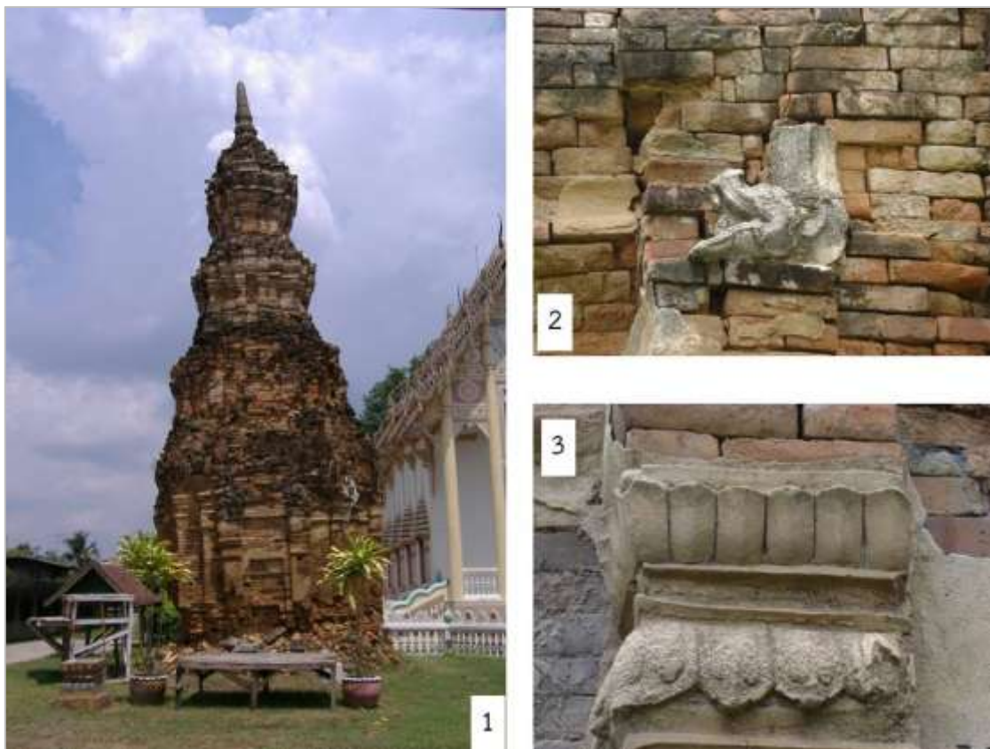
1. ธาตุเมืองจันทร์ก่อนอนุรักษ์ 2. ปูนปั้นรูปมกรบริเวณหน้าบันเหนือซุ้มจระนำองค์เรือนธาตุ 3. บัวหัวเสาปูนปั้นบริเวณเสาประดับกรอบซุ้มจระนำ

เป็นซุ้มจระนำ ประกอบด้วยเสาประดับ 2 ข้าง ส่วนหัวเสาพบหลักฐานกลีบบัวปูนปั้นประดับในบางด้าน ส่วนหลังคา หน้าบันประดับในบางด้านพบหลักฐานรูปมกรปูนปั้นประดับ ซึ่งส่วนใหญ่มีสภาพชำรุด