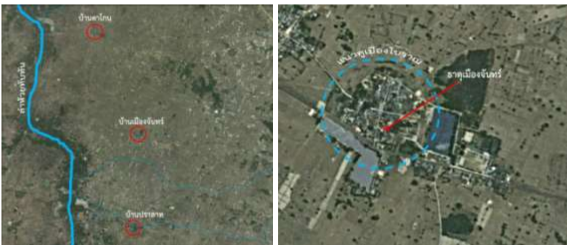
ภาพถ่ายดาวเทียมจาก Google Earth (สืบค้นเมื่อ 28 กุมภาพันธ์ 2555) แสดงที่ตั้งชุมชนโบราณบ้านเมืองจันทร์และชุมชนใกล้เคียง รวมทั้งร่องรอยแนวคูเมืองโบราณและตำแหน่งที่ตั้งธาตุเมืองจันทร์

บ้านเมืองจันทร์เป็นชุมชนโบราณที่มีคูน้ำล้อมรอบเป็นรูปทรงกลม โดยมีเส้นผ่าศูนย์กลางเมืองประมาณ 400 เมตร 2 ลักษณะพื้นที่เป็นที่ราบ มีความสูงประมาณ 131 เมตรจากระดับน้ำทะเลปานกลาง ด้านทิศตะวันออกและด้านทิศใต้ของชุมชนมีหนองน้ำขนาดใหญ่ ซึ่งสามารถเก็บกักน้ำไว้ได้ตลอดทั้งปี สันนิษฐานว่าน่าจะขุดขึ้นภายหลังเพราะบางส่วนของหนองน้ำทั้งสองแห่งซ้อนทับอยู่กับแนวคูเมืองโบราณ และห่างจากแนวคูเมืองด้านทิศใต้ออกไปประมาณ 1.3 กิโลเมตร มีลำน้ำธรรมชาติที่ไหลลงสู่ห้วยทับทันทางทิศตะวันตก